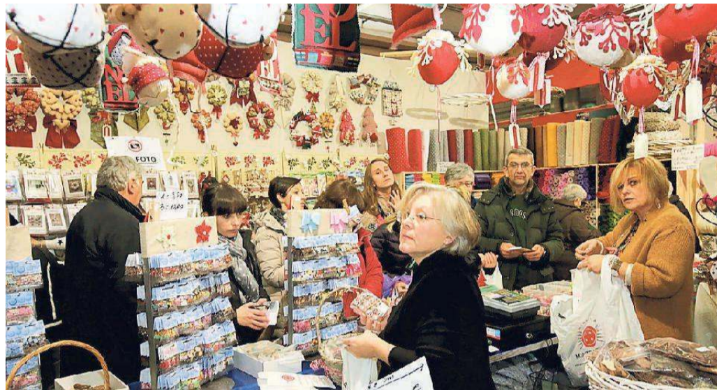
Un’immagine della passata edizione di Curiosa in fiera a Modena