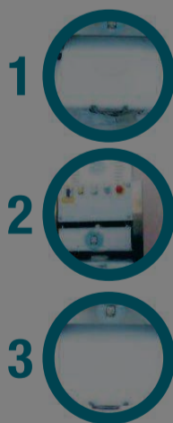
ULISSE US35-A Stendipizza