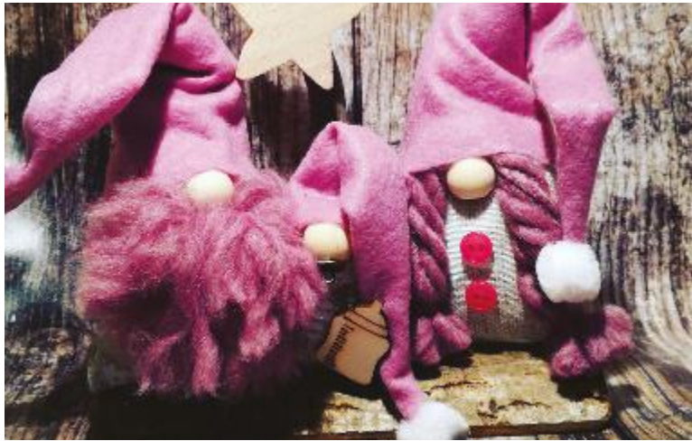
↑ La fantasia al potere